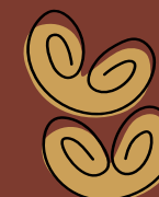
Dolci di Natale