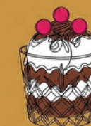
Coppe di gelato